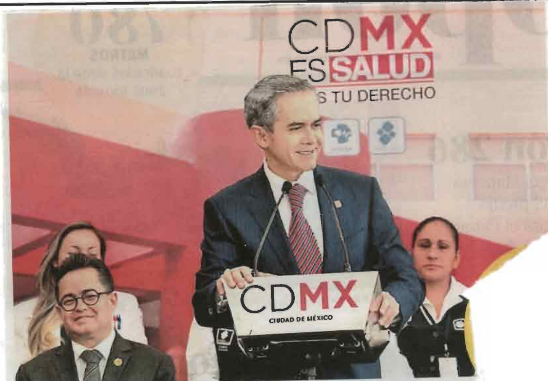
El mandatario reprochó al gobierno federal la falta de apoyo para invertir en el vital líquido