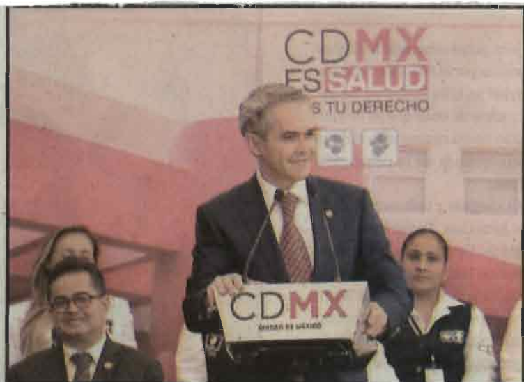
Miguel Angel Mancera.