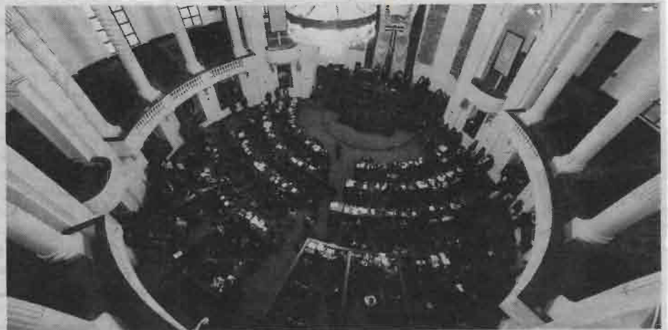
Este jueves inicia el Segundo Periodo de Sesiones Ordinarias del Tercer Año de Ejercicio.

Reiteró a la ciudadanía el compromiso de la VII Legislatura de continuar con la aprobación de instrumentos jurídicos de avanzada que colocan a la Ciudad de México como referente para los estados de la República Mexicana.