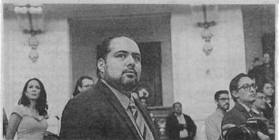
Se debe reconsiderar la intervención de fuerzas locales, así como implementar acciones de prevención y salud para los jóvenes.

Anunció que la Comisión de Seguridad Pública de la ALDF organizará una mesa de trabajo con las autoridades de la UNAM para encontrar alternativas que ayuden a disuadir el narcomenudeo.