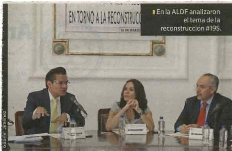
En la ALDF analizaron el tema de la reconstrucción #19S.

Por otra parte, a diferencia de los otros partidos, el PRD aún no ha donado los 25 millones que prometió la ex dirigente nacional, Alejandra Barrales, para ayudar a los damnificados de los sismos de septiembre en el País y no ha dado una fecha exacta para hacerlo.