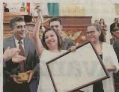
LUCIA GODINEZ, EL UNIVERSAL