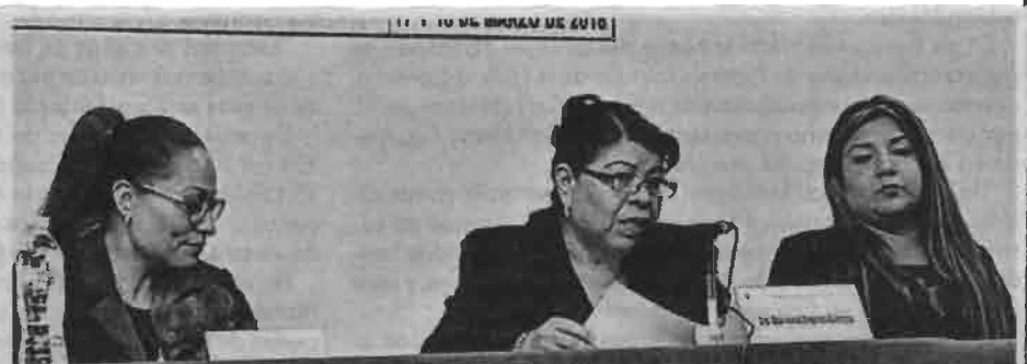
GCDMX debe intensificar campañas de prevenciones congruentes y éticas.

Por otra parte habló de la privatización de los servicios médicos de salud públicos se da de manera silenciosa y en cascada, "la mayoría de los medicamentos para tratar enfermedades metabólicas escasean; las consultas duran a lo más 15 minutos y los tratamientos o estudios de gabinete tardan entre 30 o 50 días o más cuando los resultados ya son obsoletos".