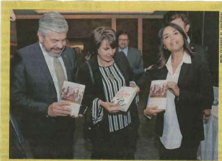
IRVIN OLIVARES: EL UNIVERSAL