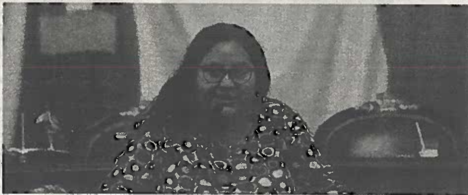
En el Día Mundial del Agua, los legisladores piden atender desabasto del vital líquido.