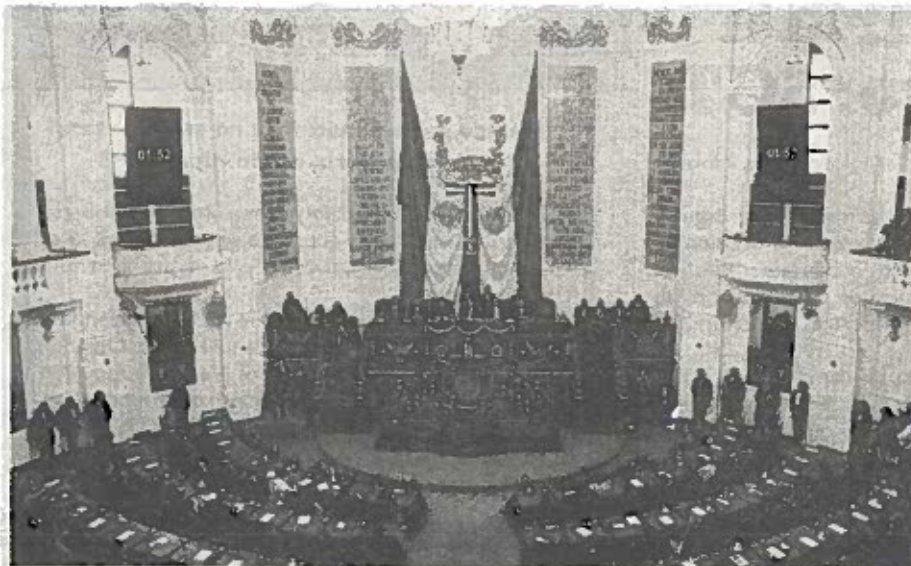
Las comparecencias ante el Pleno iniciarán el martes 3 de abril a las 09:00 horas.

Al finalizar la última replica, el Presidente de la Mesa Directiva concederá al funcionario, una vez más, el uso de la tribuna para que en 10 minutos dé un mensaje final. Posteriormente la Comisión de Cortesía acompañará al funcionario a su salida del Recinto.