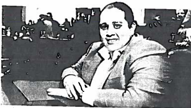
Mendoza | Reconocimiento a la PGJCDMX.

Y tiene razón porque ahora los detienen, llegan al Ministerio Público y los sueltan. Los dejan que salgan a seguir delinquiendo. Y cada vez con más violencia. Matan sin ninguna consideración. ¿O me equivoco?