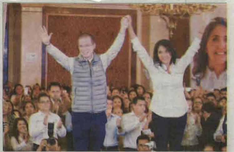
Ricardo Anaya y Alejandra Barrales, durante un evento en la Ciudad de México.