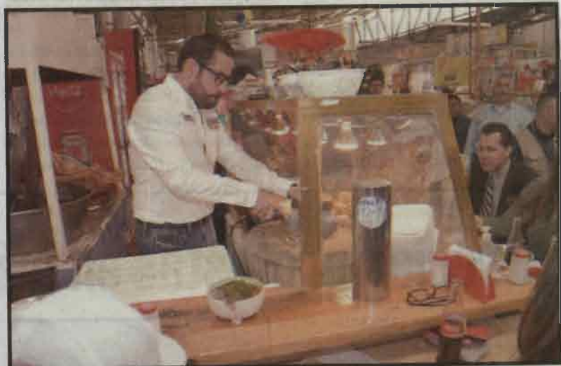
Víctor Hugo Romo. No más abusos a mujeres.

Agregó que, como alcalde, presentará una iniciativa de ley al próximo Congreso local para incluir el delito de hostigamiento sexual en la legislación, de tal manera que pueda acreditarse de manera eficaz y pueda ser perseguido de oficio.