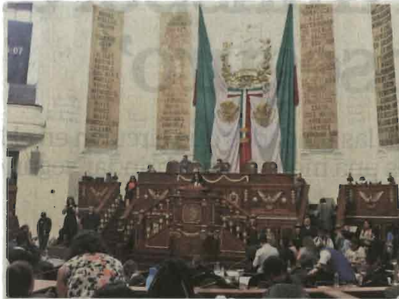
La Asamblea tiene entrampada el nombramiento de cuatro comisionados, entre ellos el presidente del organismo de transparencia local.