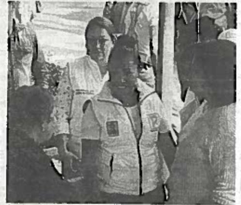
Debe haber una revisión integral a las escuelas de Iztapalapa para garantizar que estén en buen estado.

Recalcó, "la reconstrucción de las escuelas depende del gobierno federal, no era el momento para ponerse a esperar a que llegara la ayuda de la Federación, porque nuestros hijos hijas son los que sufren los estragos del temblor y no tenían un lugar en dónde tomar sus clases".