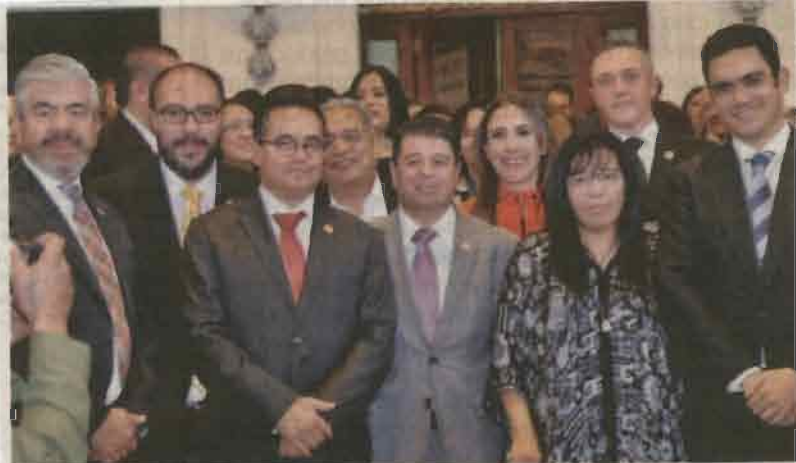
En el marco del Día Mundial de la Diversidad Cultural para el Diálogo y el Desarrollo, demandaron respeto a la diversidad en todas sus formas.

“En la Ciudad tenemos que atender los marcos legales, tenemos protocolos y una Ley de Interculturalidad que básicamente está obligando a tener traductores e intérpretes, que es diferente, al incorporar de entrada en esta Ciudad el pleno derecho a los pueblos originarios y tenemos obligaciones”. ●