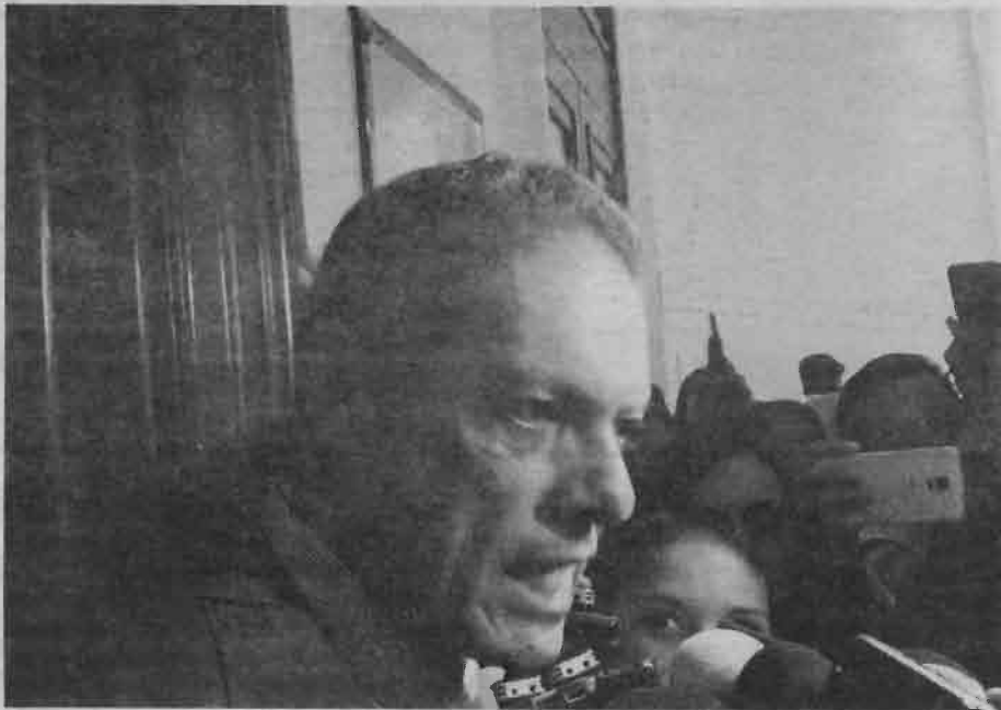
Piden información acerca de origen y estado de inmueble en Paseo de la Reforma 26.

Apuntó, se ha solicitado a la Autoridad del Centro Histórico, información acerca del origen y estado de la edificación; a fin de que se dé una explicación clara respecto al mismo, se transparente el procedimiento administrativo y se deslinden las responsabilidades legales correspondientes.