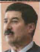
JAVIER CORRAL Gobernador (G) de Chihuahua