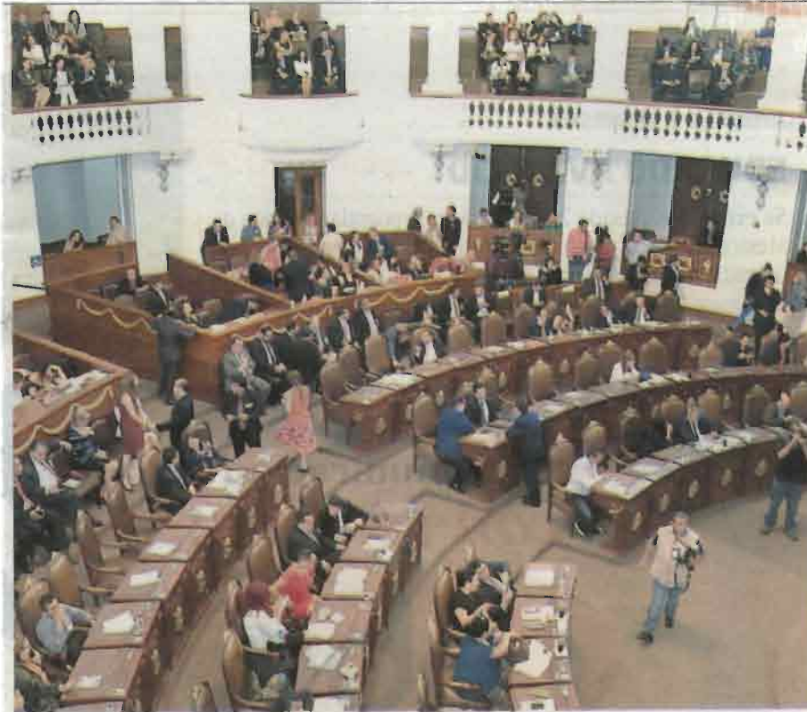
La Asamblea Legislativa conocerá de los beneficios que tendrá el nuevo programa