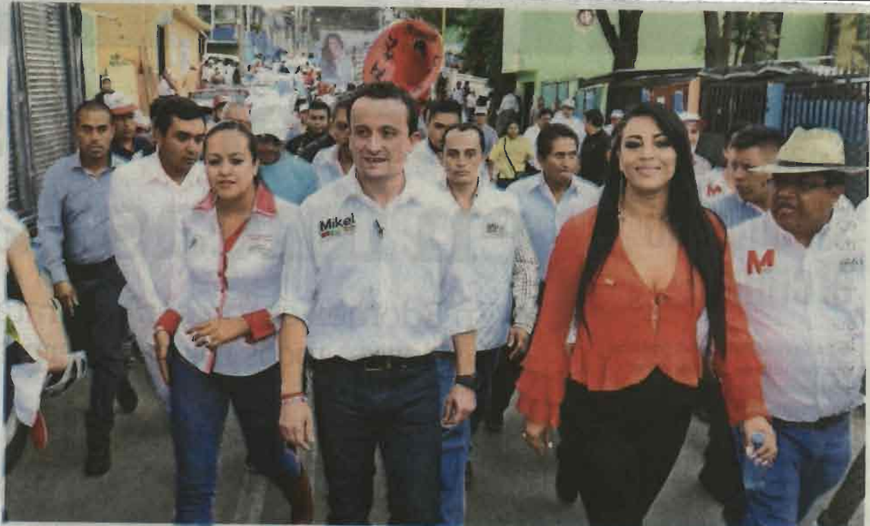
El abanderado tricolor recibió el apoyo de habitantes, pero también hubo caras largas, en varias ocasiones lo dejaron con la mano estirada y le advirtieron "que el PRD sí les cumplía" en La Joya.