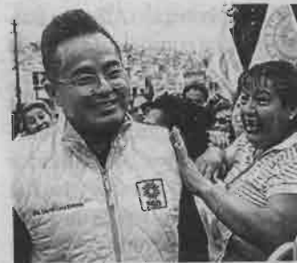
Espera que le vaya bien al país, sobre todo a la CDMX

Abundó que se debe reflexionar y dar paso a una modificación del partido, lo que sugiere, reconstruirse como un partido de izquierda moderna y progresista, además de retomar los principios que elevaron las principales causas de los habitantes de México.