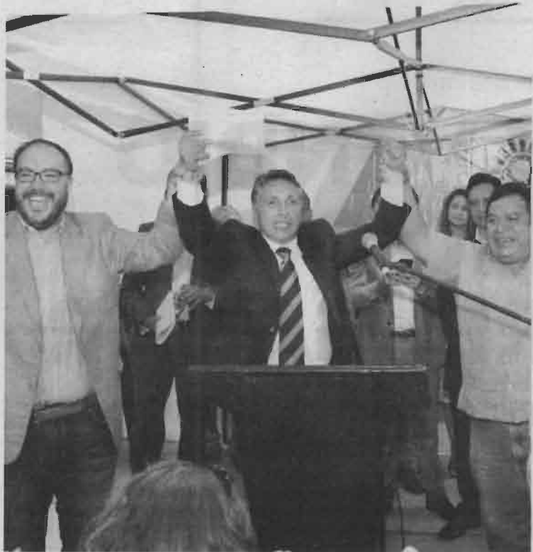
Reconoce que fue cansado pero valió la pena

La Constitución de la CDMX establece que los Alcaldes entrarán en funciones el 1 de octubre