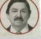
NAPOLEÓN GÓMEZ URRUTIA Morena