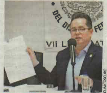
PERSONAJE. Leonel Luna, diputado del PRD en la ALDF.

integral del partido, a una ruta que priorice la cohesión, la suma de los múltiples actores sociales, políticos, académicos e intelectuales de este país", dijo. /REDACCIÓN