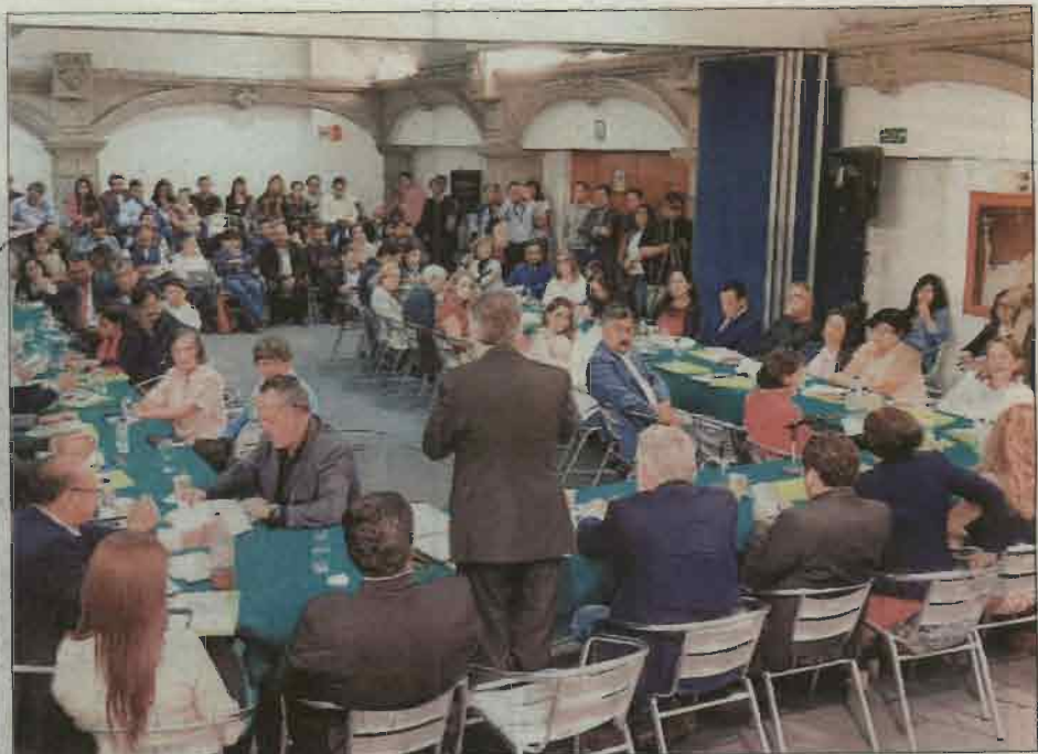
Los representantes locales se registrarán con total austeridad y sin privilegios.

"Todos los recursos se orientarán fundamentalmente al desempeño legislativo. Habrá que reducir la estructura administrativa que se engrosó innecesariamente para que sin limitar nuestras capacidades