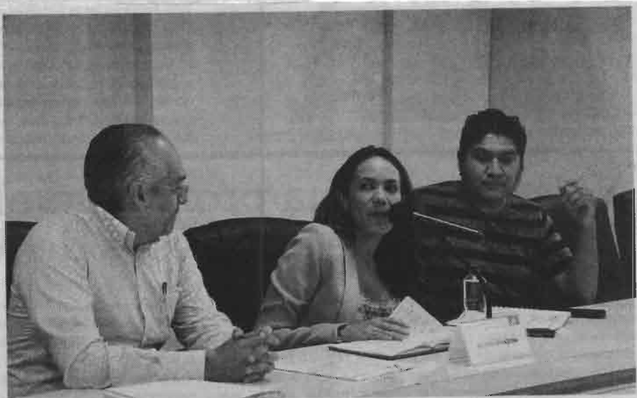
Inició el proceso de extinción de las Comisiones; fueron entregadas las oficinas que ocupaba la Comisión de Vivienda.

Solicitó al próximo Congreso subsanar el problema que está generando la póliza de fianza que se pide para poder escriturar inmuebles en la CDMX porque está obstaculizando el trámite, para ello, sugirió presentar una póliza de seguro que facilite la escrituración.