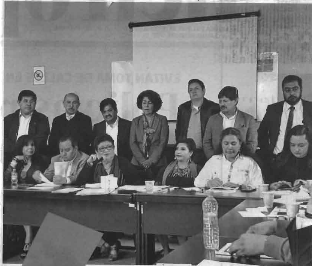
Diputados y alcaldes electos de Morena en conferencia de prensa ayer