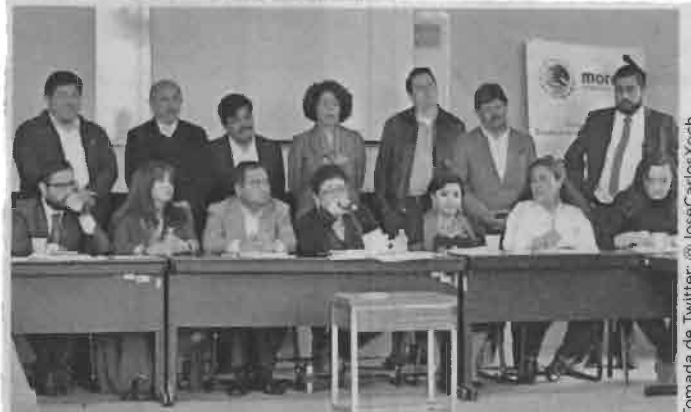
Alcaldes electos de Morena se reunieron los diputados entrantes para acordar la agenda de trabajo.

El 17 de septiembre arrancan los trabajos de la Primera Legislatura del Congreso de la CDMX y entra en vigor la Constitución local.