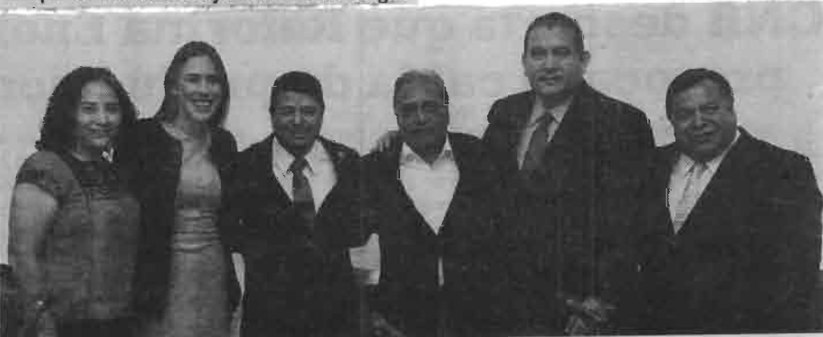
Ratifican a Barba Lozano como magistrado del TJACDMX.

Apuntó, "desafortunadamente no se registró el número de diputados necesario, por ello se vuelve a convocar para agotar el tema. Cada uno de los diputados conoce de las implicaciones de no asistir, sobre todo a esta reunión, por ello hacemos un nuevo exhorto recordándoles que su tarea y compromiso con la ciudadanía concluye el 16 de septiembre".