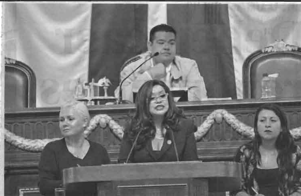
Los diputados locales sólo tienen cinco días para sesionar en periodo extraordinario