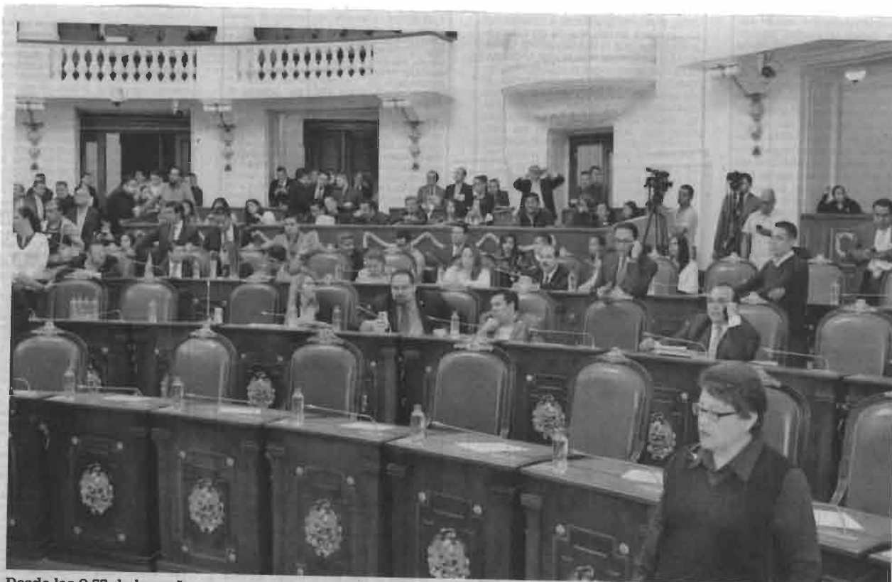
Desde las 9:55 de la mañana se escuchó el tradicional timbre de llamado para los diputados locales, hubo pase de lista y la asistencia fue mayúscula, pero al momento de la votación, los assembleístas de Morena se habían retirado.

Los legisladores locales advirtieron que se agotarán todos los instrumentos legales para poder realizar el extraordinario y sacar adelante la determinación del juez, pues lo que está en juego es evitar caer en desacato y que implica castigo hasta con cárcel. ●