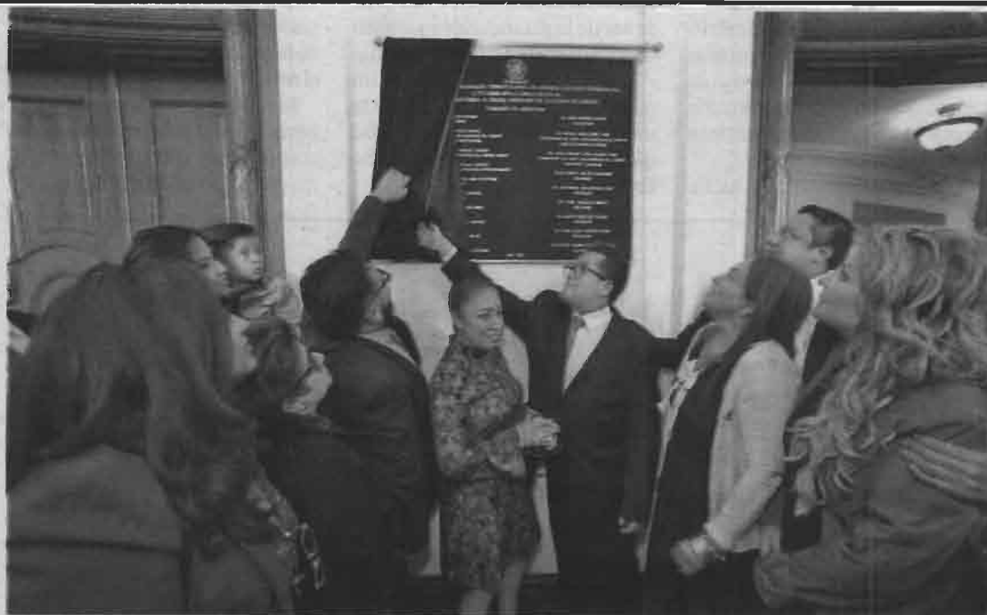
Develan placa conmemorativa a un costado de la entrada principal del salón de plenos.