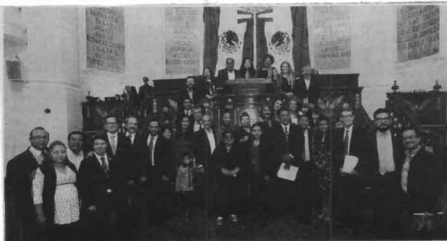
La ALDF termina su ciclo a las 23:59 horas del domingo 16 de septiembre.