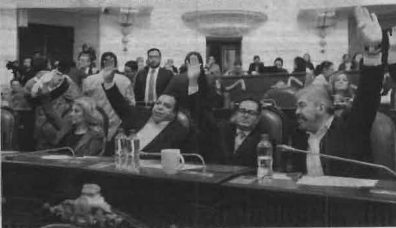
■ Los asambleístas sesionaron un día después del plazo dictado.