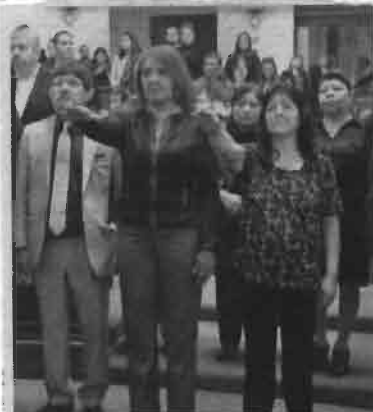
■ Diputadas suplentes tomaron protesta en la última sesión.