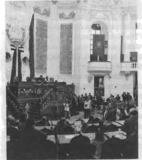
Ayer concluyeron los trabajos de la última ALDF

Con esto se cerró la última sesión de la ALDF para dar paso al nuevo Congreso.