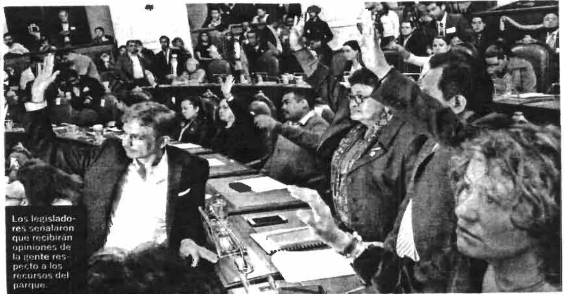
Los legisladores señalaron que recibirán opiniones de la gente respecto a los recursos del parque.

"No es un asunto donde no haya recursos; si estuviera en cero el tema de la reconstrucción, a lo mejor hasta se justificaría hasta no oír las opiniones, pero no es así, hay recursos en el gobierno para continuar el tema de la reconstrucción", manifestó.