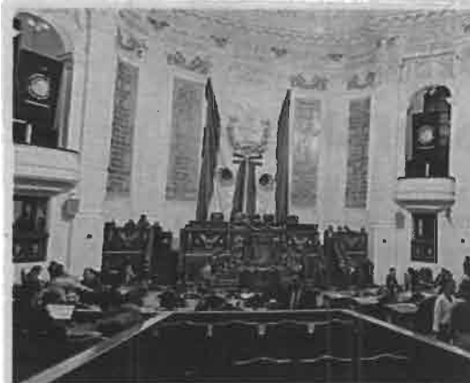
Hoy protestarán ante el Congreso local