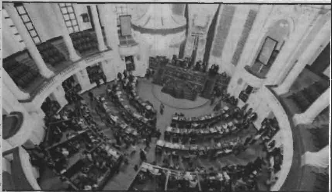
Día histórico para la Ciudad de México.